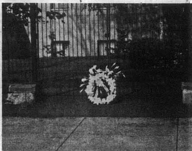
Білі брами — вінок з білих лілій.

затори і керівники маніфестації, парламентаристи і послі, промовці і представники політичних, громадських і духовних організацій і установ.