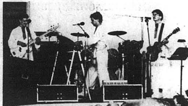
Оркестра „Веселка” з Монреаю.