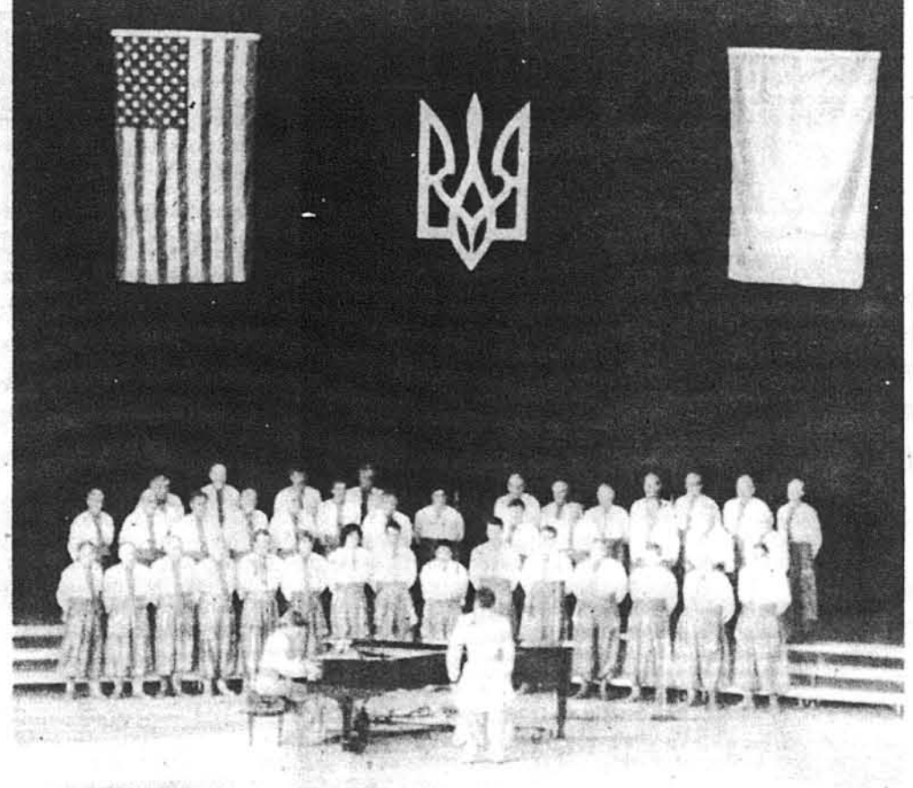
Хор „Прометей” з Філадельфії на великій сцені амфітеатру.