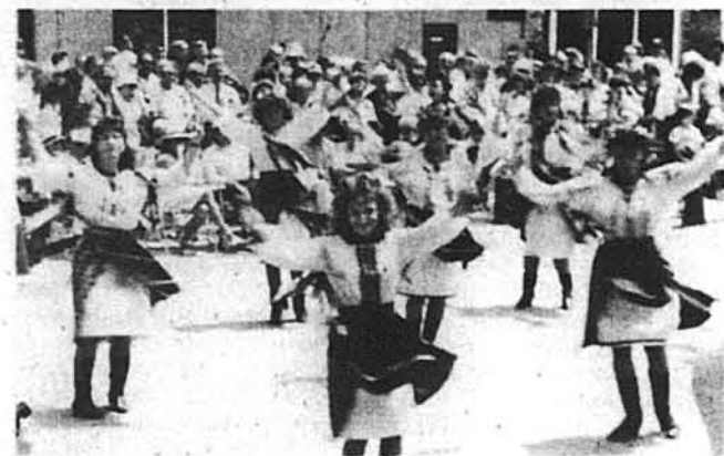
Молодьки танцюристки виступають під час популярної програми.

цьогорічному концерті на сцені Гарден Стейт Арте Центру вперше виступили чоловічий хор „Прометей” з Філадельфії під диригуванням Михайла Дябоги, танцювальний ансамбль „Чайка” з Йонкеру, Н. Й., та керівництвом Ореста Русинка. Вперше були запрошені гості з Монреаю, Канада — оркестра „Веселка” (керівник Рон Каланік) та молода співачка Лєся Волянська.