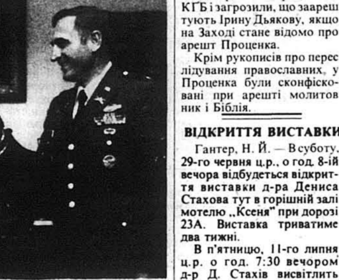
Генерал Микола Кравців зі секретарем Департаменту оборони Каспаром Вайнбергером.

Тому він, у порозумінні із своєю етнічною комісією, проголосив тепер листу 87 осіб із різних національностей та з різних професій, що народилися поза ЗСА, мають американське громадянство, або його дістають і зробили вклад у розвиток міста, чи цілої Америки.