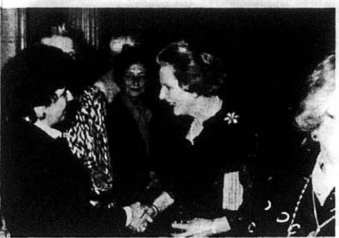
Українська делегатка Ірина Куровицька вітається з прем'єр-міністром уряду Великобританії Маргарет Тачер.