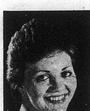
Співачка Ліда Гаврилюк