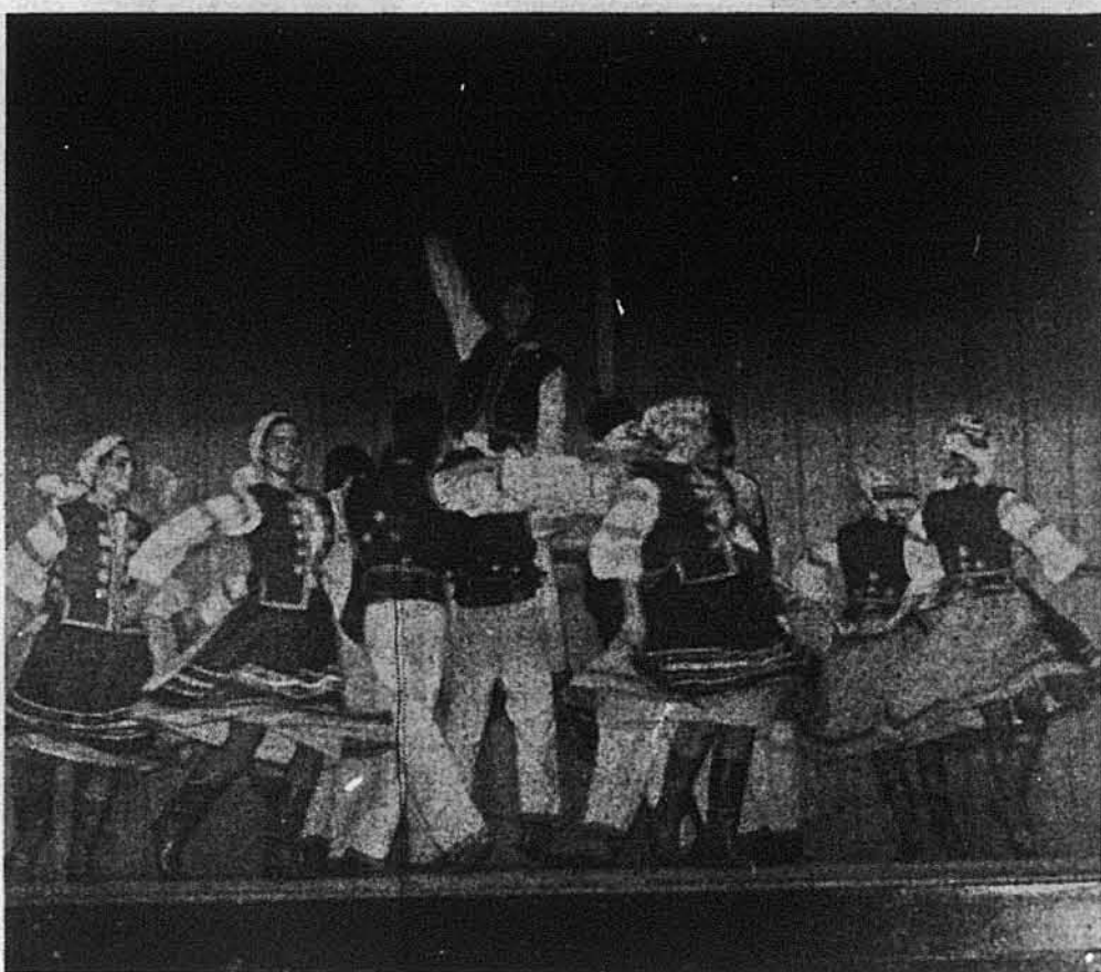
Група старших танцюристок