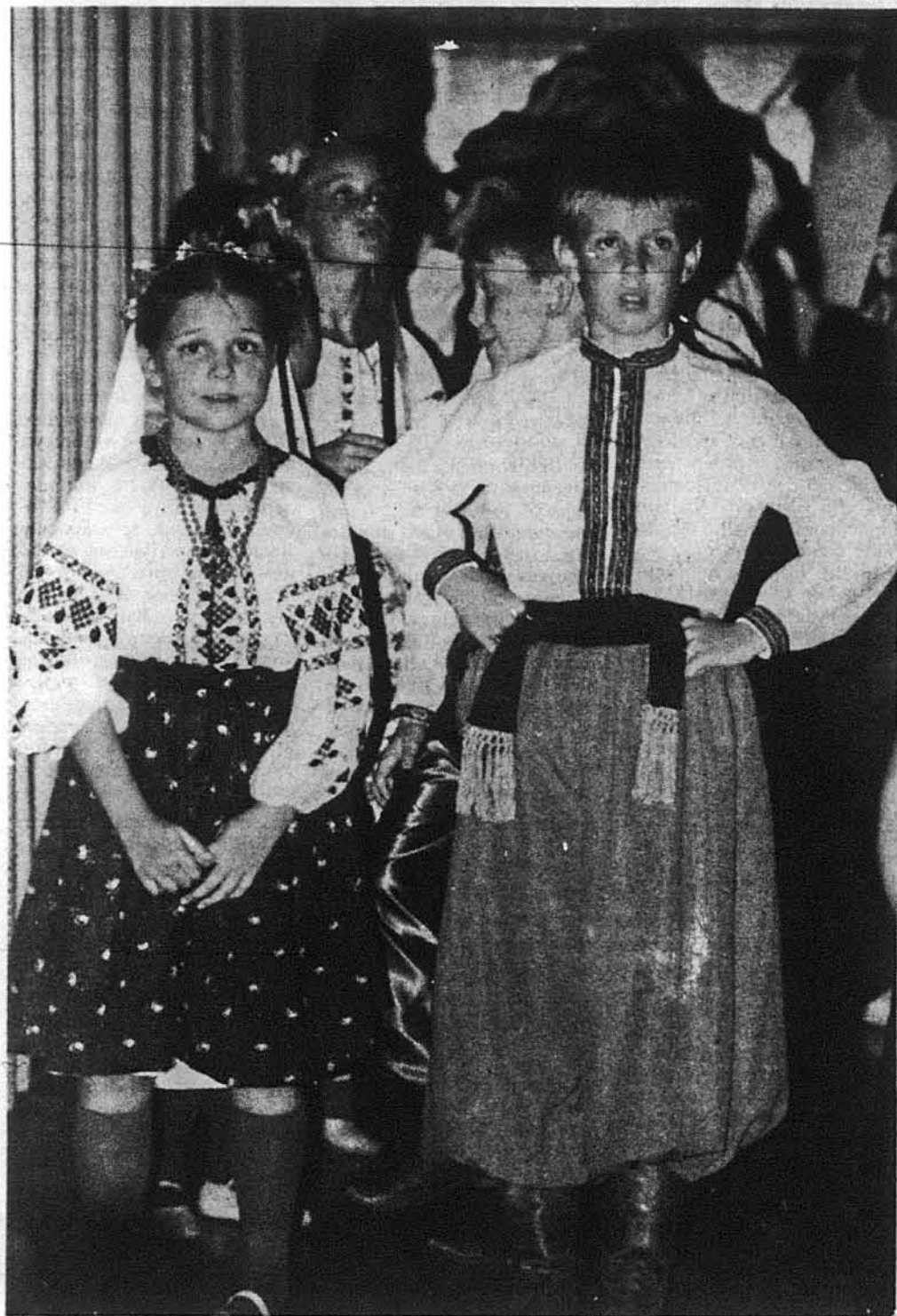
Наймоладші приготуються до виходу на сцену