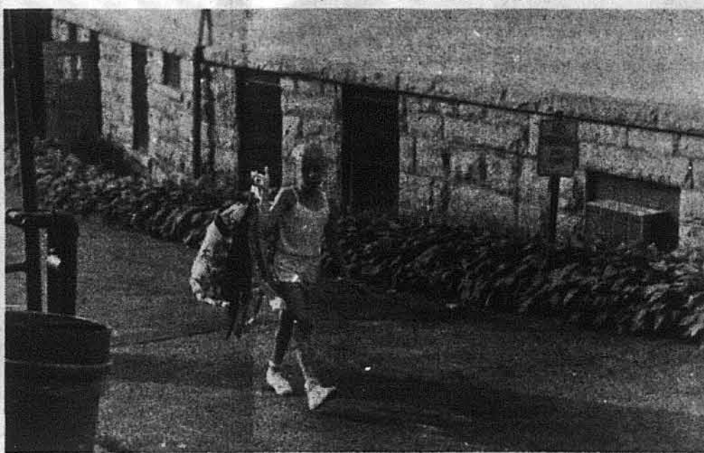
Швидка вечеря—і треба переодягатися