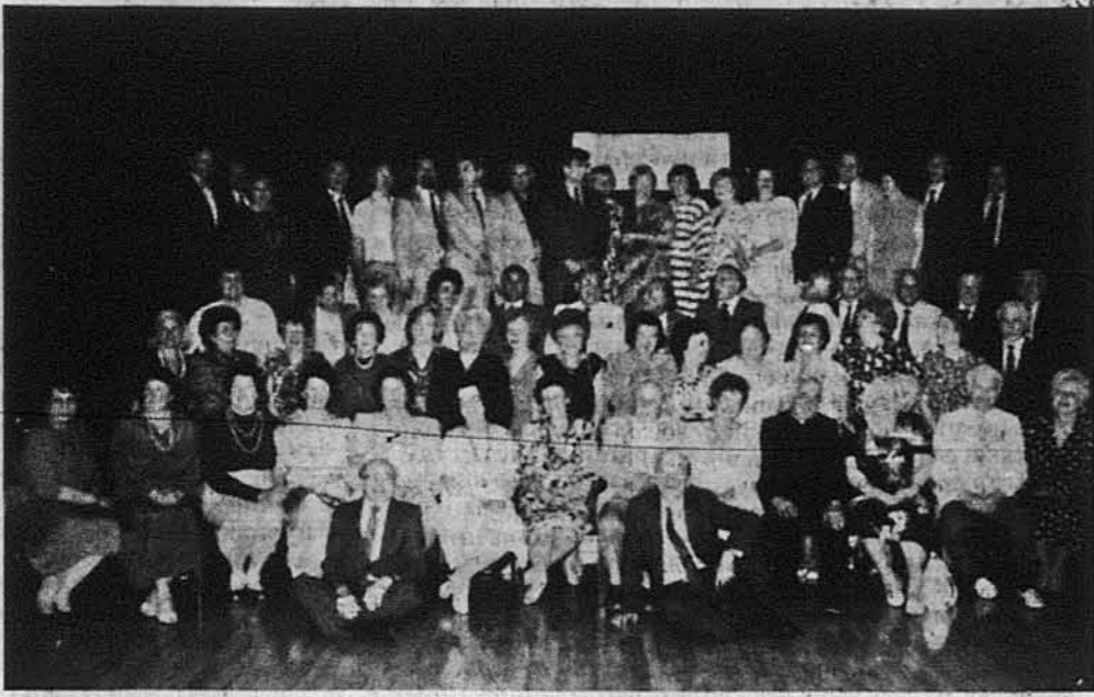
Учасники з'їзду української гімназії в Ашафенбурзі.

У днях 30 і 31-го травня ч. р. на оселі „Союзівка“ відбувся Перший з'їзд професорів та учнів колишньої гімназії в Ашафенбурзі. Після 40 літ з'їхалося понад 70 учнів з родинами, щоб зустрітися та пригадати молоді роки в таборах після воєнних часів. Учасники прибули з Австралії, Канади й ЗСА.