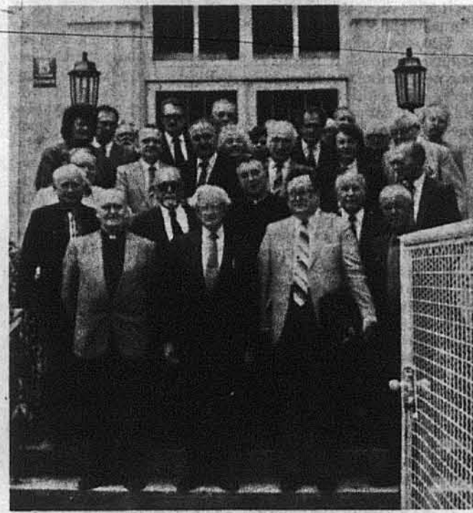
Група учасників Конференції перед будинком УВУ в Мюнхені.