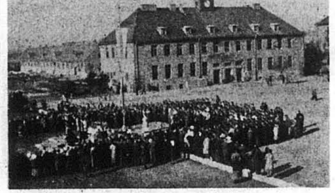
Служба Божя на свято Покрови в таборі Сомме Косерне в Авгсбурзі.

(Думки з приводу з'їзду колишніх мешканців українського ДП табору в Авгсбурзі-Ляйпгайм)