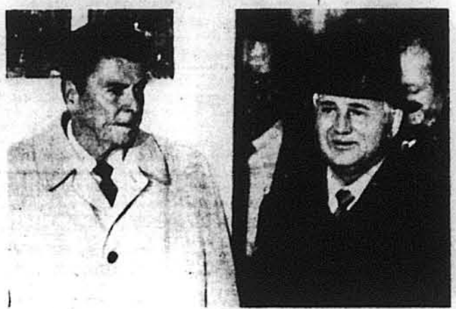
Суворий вигляд президента Р. Регена при прощанні з М. Горбачовим не судив нічого доброго про вислід розмов.

Совєтські засоби масової підсовєтської проблемати-інформації, а зокрема газети кажуть що коментарі, та „Правда“, орган ЦК КП-критика і антиамерикансь-СС, подали тільки сухі ін-ка пропаганда розпичеть-форматії про закінченняся правдоподібно незабаронарад в Ісландії, але знавці ром.