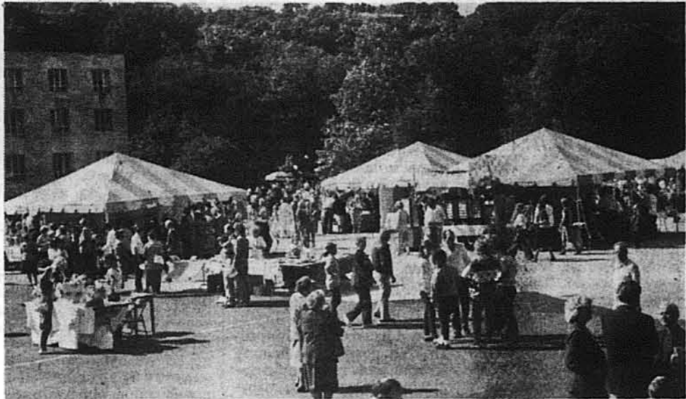
Тисячі людей насолоджувалися танцями, музикою, піснями і кулінарним мистецтвом.