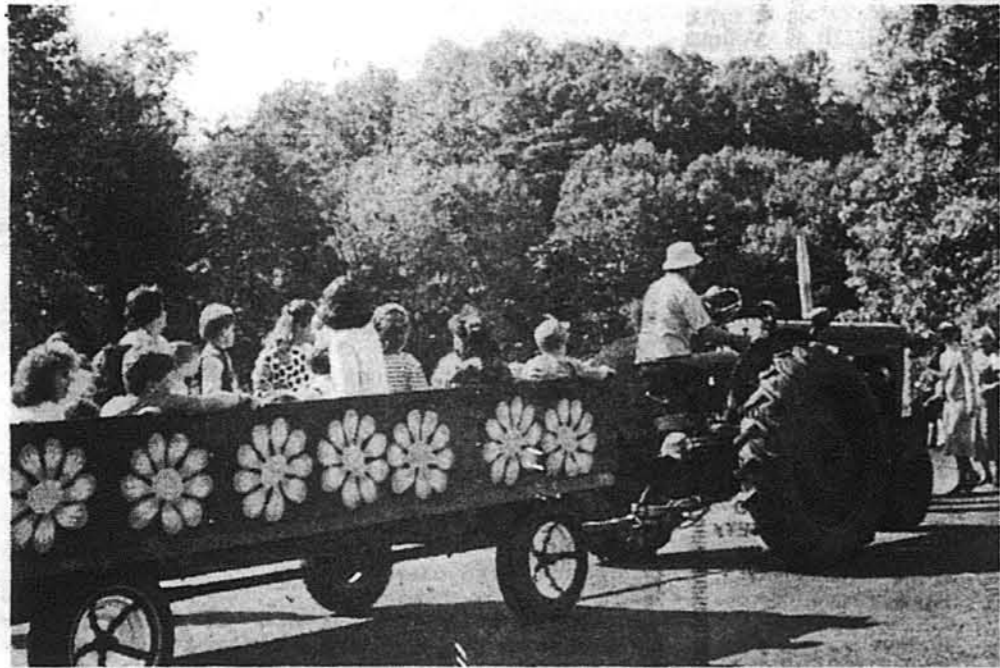
Понад 320 розвезених дітей об'їжджали на возі довкола Менор Джуніор коледжу.

зеї, комерційні виставки народних виробів на шкільній площі, виступи мистецьких ансамблів, розваги під голім небом і забава з музику в шкільній аудиторії.