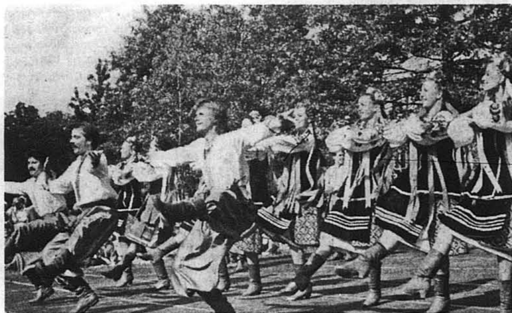
Українські танцюристи з ансамблем „Чайка”, Йонкерс, Н.Й., пописуються перед тисячами глядачів.

На програму фестивалю зложилися: виставка образів і скульптур в залі коледжової бібліотеки, показ мистецької творчості в Му-