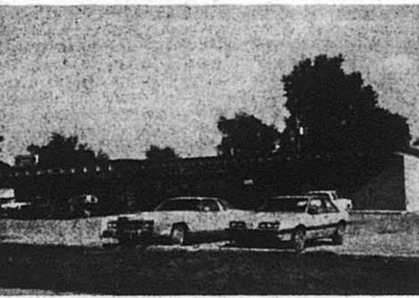
Новозакуплений дім СУА.

Воррен, Миш. — Окружна Управа СУА в Дітроїті закупила будинок для житку своїх членів в центрі недавнього поселення українців на сході міста у Воррені, Миш. Будинок СУА знаходиться в близькому сусідстві української католицької церкви св. Йосафата, Українського Культурного Центру, Української Кредитки „Самопоміч“ і „Українського села“. Недалеко мають свої канцелярії українські лікарі і знаходиться тут також декілька українських промислово-торговельних підприємств. Новозакуплений об'єкт — це партеровий мурований будинок з прилеглою паркувальною площею. В новому приміщенні, після його пристосування до житку, знайдуть „свій кут“ канцелярії Відділів СУА, а також примістяться там збірка народних одягів, ляльок та інших мистецьких предметів.