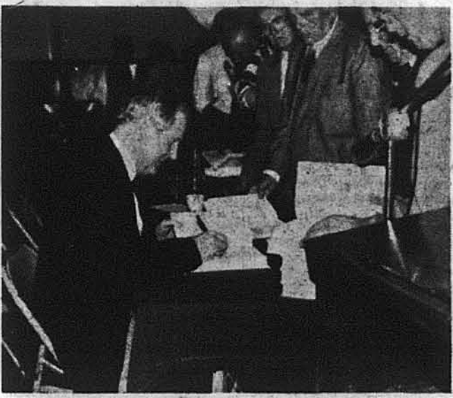
Д-р Р. Конквест підписує примірники своєї книжки.

Довгоочікувана зустріч з автором монументальної праці під назвою „Жнива смутку“ доктором Робертом Конквестом відбулася тут в неділю, 26-го жовтня н. р., в просторій квартирі українського Культурного Осередку при уряді численних присутніх, які прибули в цей день шоби особисто зустріти великого приятеля українців та оборонця нашої історичної правди.