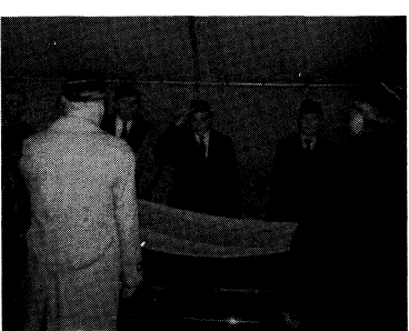
Українські ветерани віддають останній салют генералів.

рохіянином, від часу приїзду до ЗСА. Зауважимо, що Божу провадив парох катедрі о. В. Базилевський в послужній отців І. Такуча і С. Кіндзерського-Пастуха, який виголосив прощальне слово. Відчитано також кондолоенційні послання Блаженнішого Митрополита Української Православної Церкви Мстислава та Владимира Антонія. На кінець зачитано трину та відкрило її український національний прапором. Довга валка авт вирушила на український православний цвинтар св. Андрія Первозваного в Баярд Брук. Там зустріли тіліні останки генерала П. Григоренки. Митрополит Мстислав та провів у церкві-пам'ятнику Панахиду на закінчення якої попросив тепліми словами ген. Григоренка. Церква-пам'ятник була вивіснена на вшесті учасниками похоронів, багато з яких, зокрема представників кримських татар, які приїхали окремим автобусом, мусіли стати перед церквою.