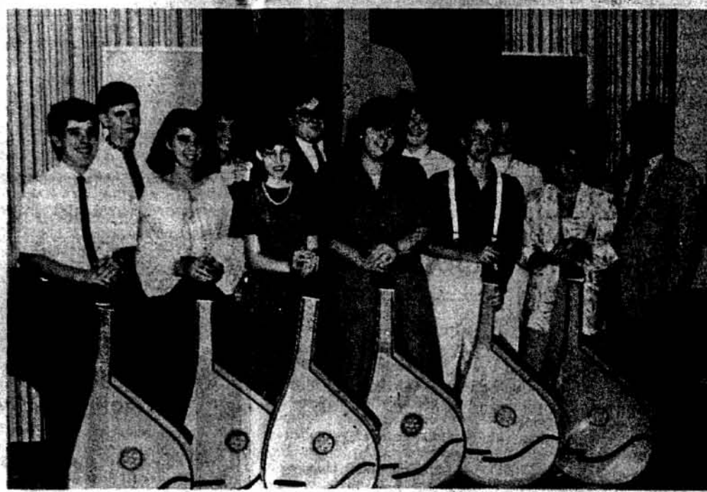
Школа Бандури ім. Григорія Китастого з Парми, Огайо, на успішному річному пописі.