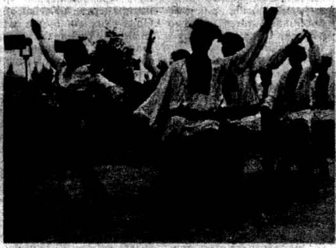
Група танцюристів ансамблю „Черемош“.