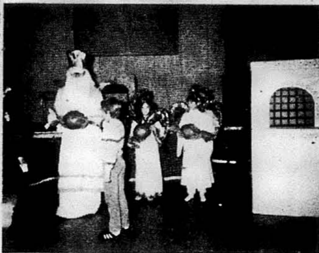
Св. Миколай дарує конячий м'яч.

У суботу, 12-го грудня 1987 року о 4-й год. по полудні в гімнастичній залі школи св. Івана Хрестителя в Ньюарку, Н. Дж., 214-й Відділ УНС „Чорноморська Січ” відсвяткував свято-миколайську зустріч, вла-