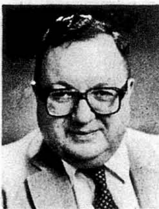
Проф. Я. Білінський

Нью Йорк. — Найвищим керівним органом Української Вільної Академії Наук у ЗСА є конференція дійсних членів, яка вибирає на чотири роки президента та Управу. Остання така конференція відбулася тут 10-го жовтня 1987 року, в якій взяло участь 22 дійсних членів.