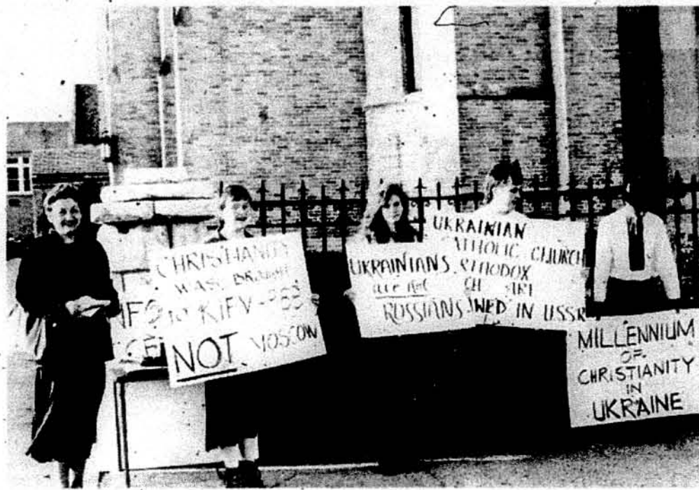
Учасники акції 15-го травня ц.р. перед римо-католицькою катедрою св. Агнеси в Роквілл центрі.

4:00 доповідь (д-р Богдан Футей). Концерт — хор „Прометей“ (диригент Михайло Дябога).