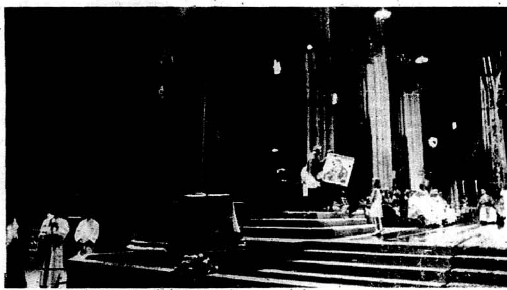
Кардинал Дж. О'Коннор приймає картини Початкової Божої Матері