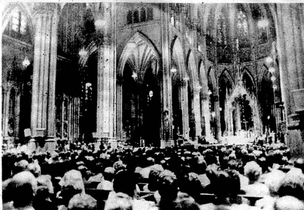
Вірні заповнили катедрі св. Патрика