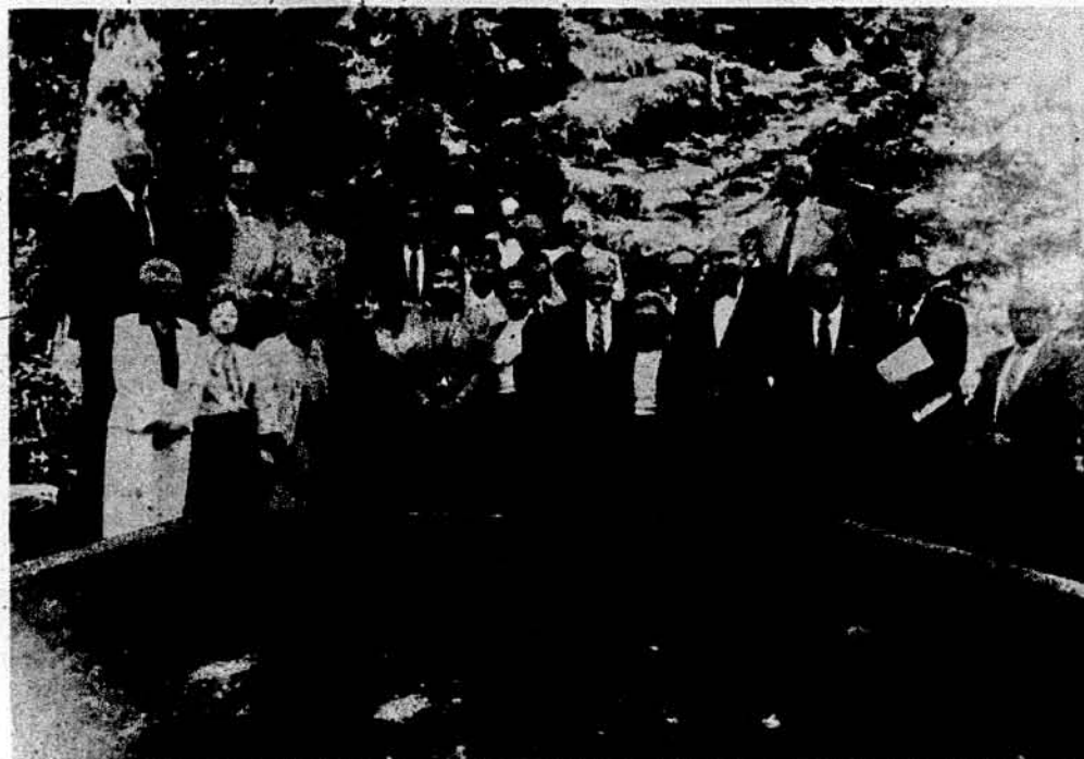
Члени Головного Уряду УНСОЮЗУ біля пам'ятника Т. Шевченка на Союзувці перед відкриттям наради.

Після понад-одногодинного розгляду пропозицій щодо місяця наступної Конвенції УНСОЮЗУ в 1990 році, при чому розглядали такі міста як Чикаго, Філадельфія, Маямі і готель Іраїт біля Союзувки, таємним голосуванням запропонува-но Балтимор для ґрунто-