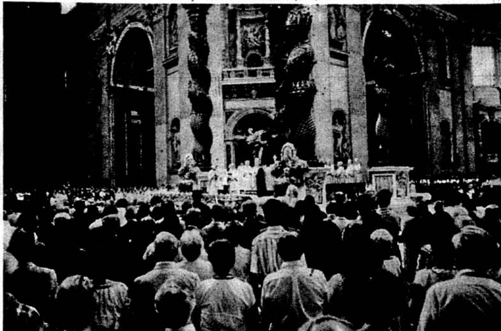
Загальний вид на базиліку св. Петра в Римі.