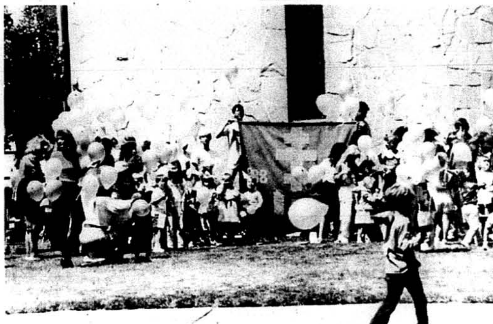
Частина парафіяльної молоді собору св. Володимира випускає балони із картками про Тисячоліття.

По відправі у парафіяльному осередку наймолодша молодь святкувала цей день народження нашої церкви. Старша молодь приготувала дві хоругви для храму і церковного осередку та читала статті про ювілей, які вони написали. Під звук дзвонів о 12 годині молодь випустила 150 синіх і жовтих балонів із картками про Тисячоліття. Кожна дитина отримала малий