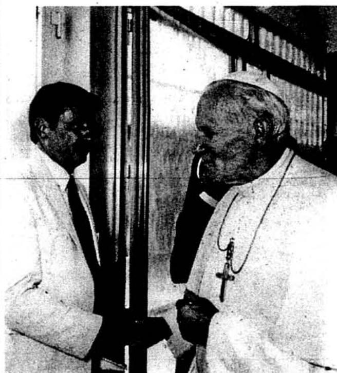
Голова Ділового Комітету Тисячоліття в ЗСА д-р Юрій Солтис з Папою Павлом Іваном II.

Немає і не може бути прощення червоним російським верховодам та їхнім співробітникам типу Сталіна, Кагановича і тисяч інших, що поповнили акт геноциду: що фізично нищили український народ. Українці у вільному світі та в Україні не можуть допустити до цього, щоб світ про це забув. Правосуддя обов'язково повинно відбутися.