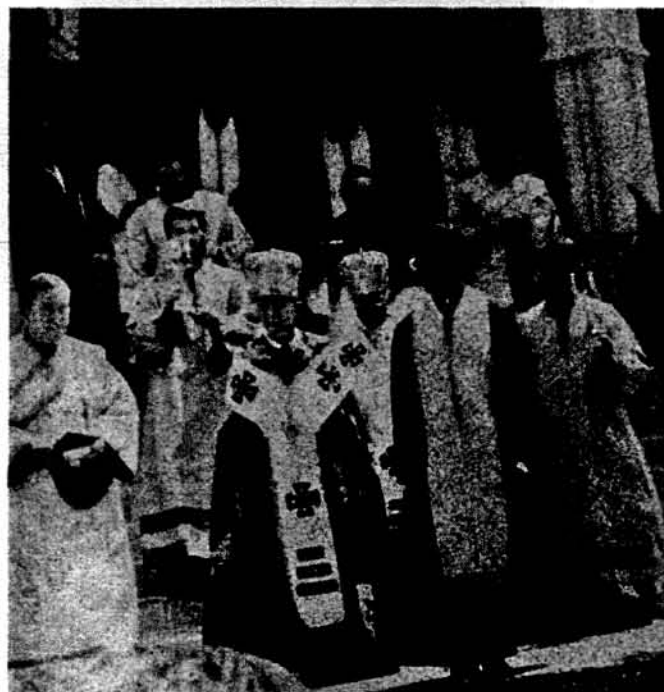
Формуються процесія на чолі з владиками.

Чикаго (М.С.). — Центральною точкою загальногромадських ювілейних відзначень Тисячоліття Християнства в Україні метрополітального Чикаго і околиць був Соборний Молебень з освяченням води, що відбувся в неділю, 31-го липня ц.р., в пополунодні години, у заміському Олів Парку над озером Мішиґен.