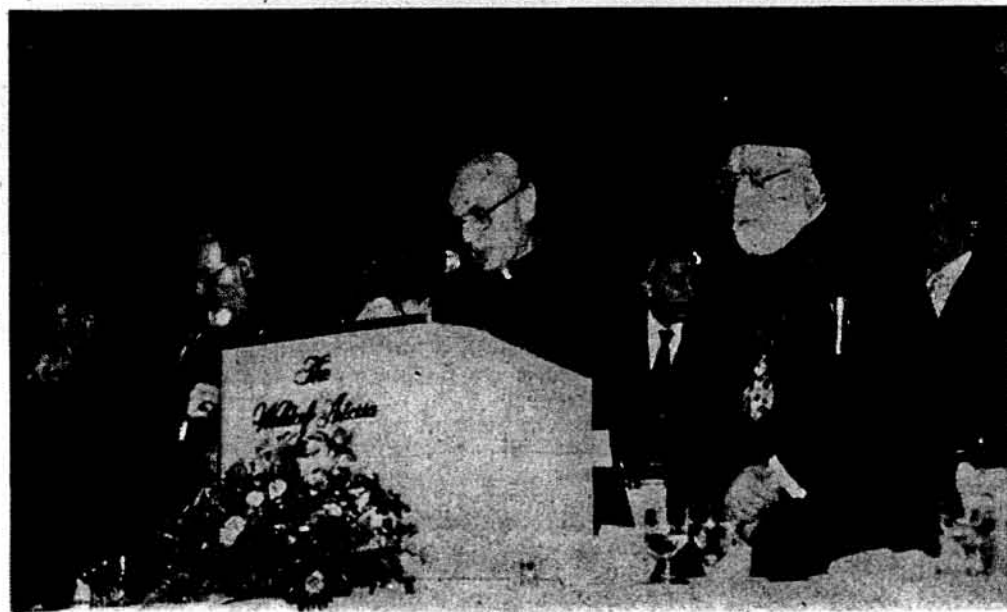
Присутні Владики (зліва) Всеволод, В. Лостен, С. Сулик і гості Архископ Яковос.