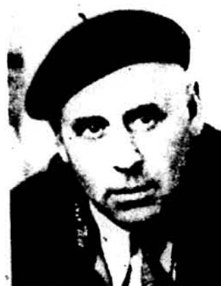
Св. п. Г. Крук

Мистецькі праці скульптора Г. Крука виставлялись в Берліні, Римі, Парижі, Лондоні, Мюнхені, Нью Йорку, Торонто, Бонні, Дітроїті й багатьох інших країнах та містах. Мистець студіював у Краківській академії мистецтв, згодом у Берлінській і Римській. Його скульптури визначаються психологізмом у портретах; його улюблена тематика — типи селян, в яких Крук відтворював первісну примітивність людини, зв'язаній з землею й працею на ній („Селяни“, „Скитальці“, „Прачка“, „Варігана“, „Швачка“ й багато інших).