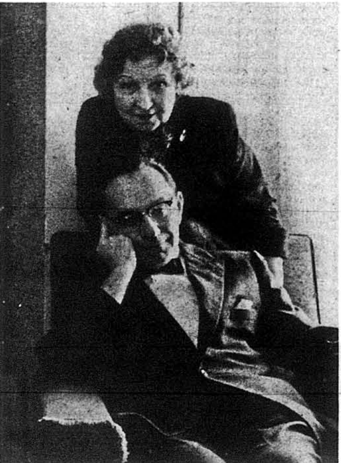
Й. Гіряк з дружиною О. Добровольською з часів активної участі в театральному мистецтві.

Нью Йорк, Н. Й. — Тут у вівторок, 17-го січня 1989 року, помер на 94-му році життя видатний актор, режисер і мистецький керівник ряду українських театрів Йосип Гіряк. Народився 14-го квітня 1895 року в Західній Україні, як сьома дитина дяка Йосипа Гіряка, вже змалечку він цікавився театром і як учень гімназії у Станіславові брав участь у аматорських виставах. Професійна кар'єра Й. Гіряка почалася з утворенням Стрілецького Театру в кінці 1915 року, коли він надіягнув мундур січового стрільця. Дали