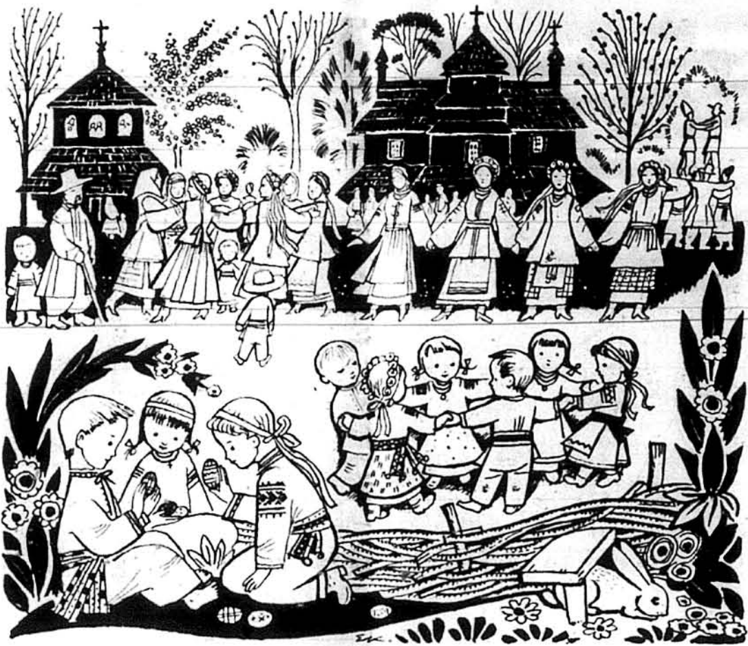
Ілюстрація „Великодні гайки” — Едварда Козака.

В Канаді: St. Mary's (Toronto) Credit Union Ltd., 832 Bloor Street West, Toronto, Ontario M6G 1M2, c/o Rev. Wasyl Pryjma, Canada