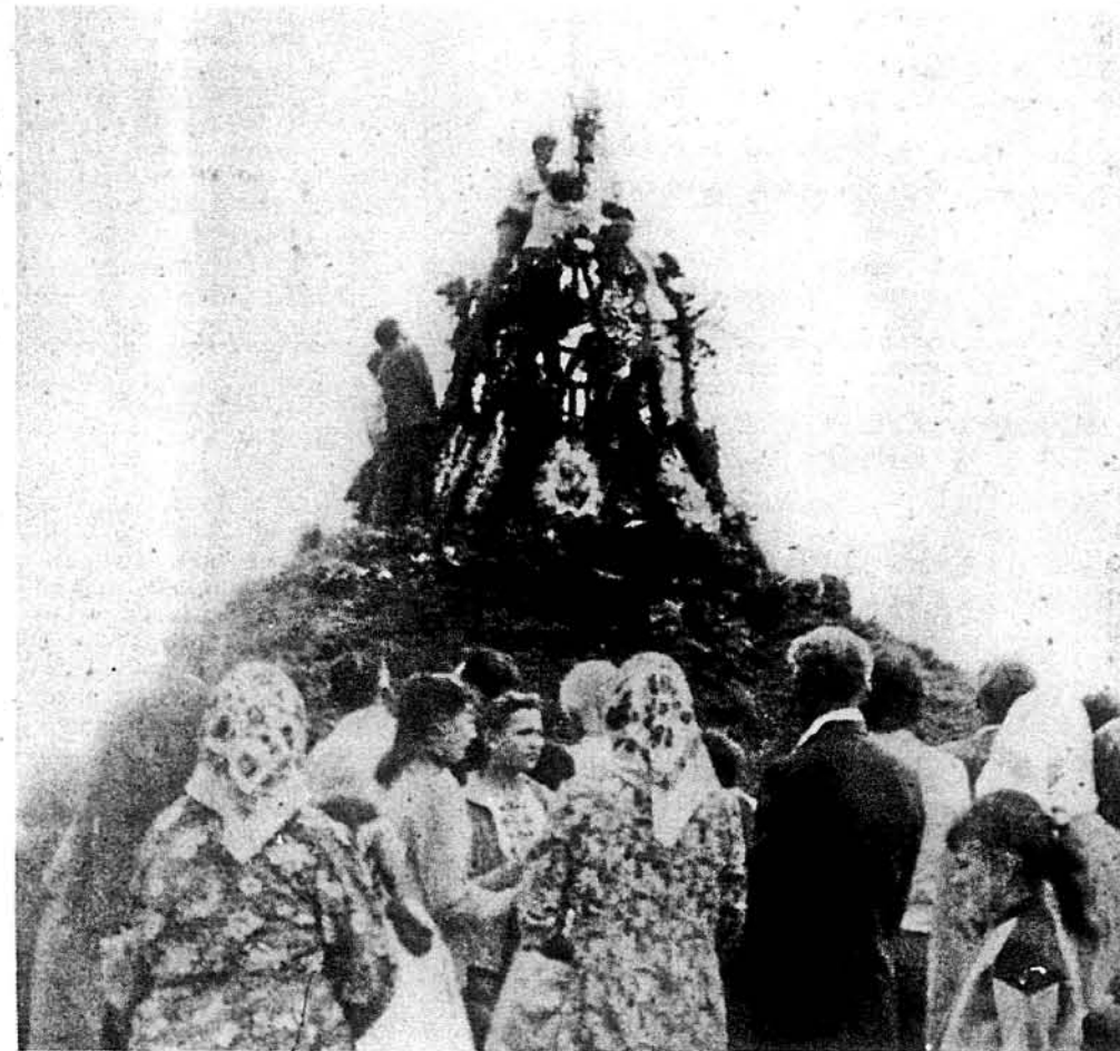
Прибрання могили закінчено, на щоглі замайорів блакитно-жовтий прапор.