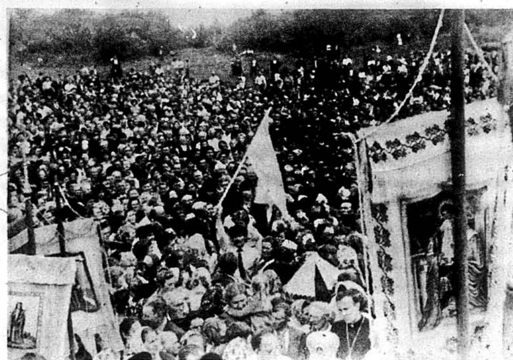
Тисячі осіб зібралися на Лисоні на чин посвячення висипаної могили та відправлення Панахиди за погблих Українських Січових Стрільців.

Цікавим є те, що, не зважаючи на всякі покарання та застрашування зі сторони властей, народ таки гуртується та виступає в обороні дідовських традицій, а доказом цього є теперішні події на Лисоні.