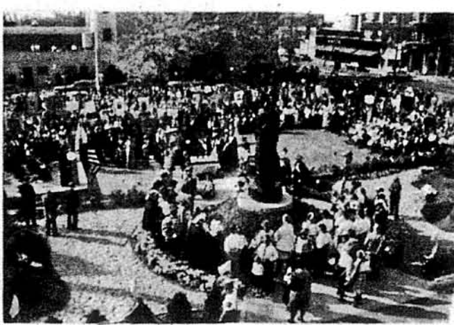
Фрагмент із посвячення пам'ятника.

кувань української громади, посвячення ново-збудованої школи, храму св. Володимира й Ольги.