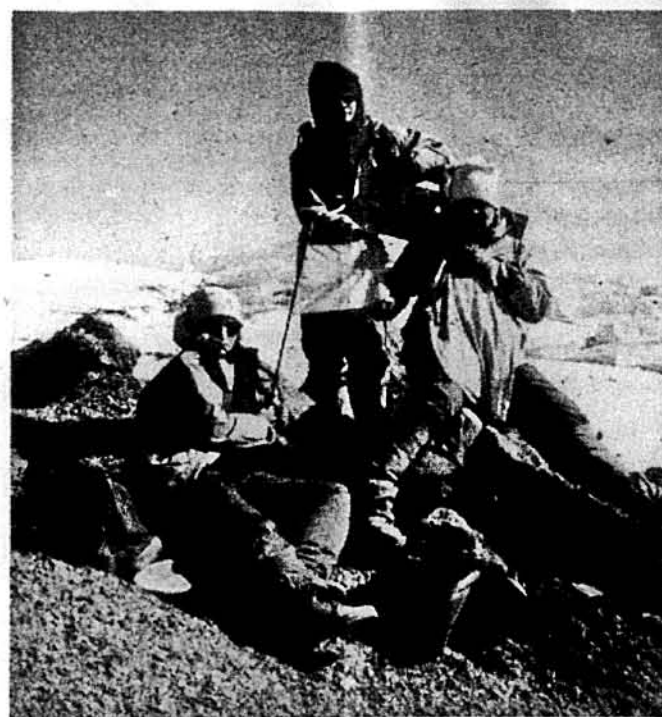
Українські туристи на вершні Кіліманджаро в Африці.