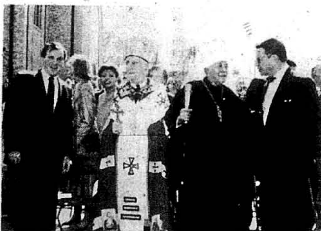
Владика розмовляють з сен. П. Саймоном (справа) і посадином Чикаго Р. Дейлі.