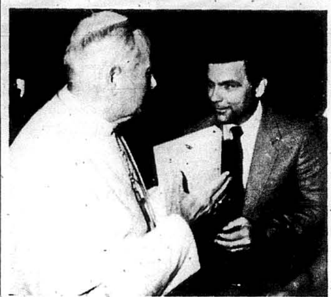
Професор Павло Р. Магочий дарує Святішому Отцеві, Пані Іванові Павлові II, книжку про Митрополита Шептицького.

Професор Павло Р. Магочий, керівник Катедри Українознавчих Студій при Торонтонському університеті, був прийнятий на аудієнцію Папою Іваном Павлом II. Причій нагоді проф. Магочий подарував Пані книжку „Моральність і дійсність: життя й часи Митрополита Андрія Шептицького“ у спеціальній оправі, що появилася недавно під редакцією професора.