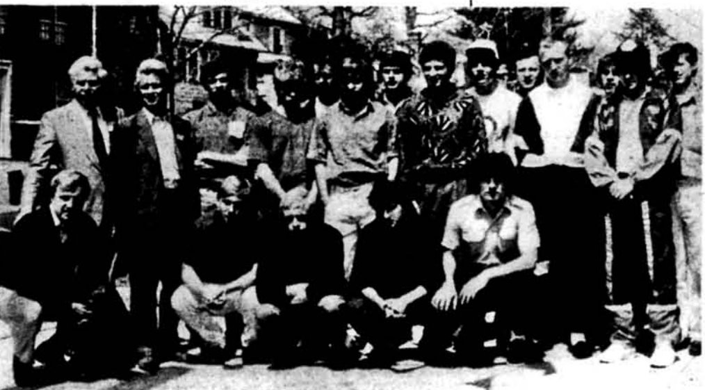
Юнаки з „Карпат“ біля будинку „Січі“ в Ньюарку

Ньюарк, Н.Дж. (О.Т.). — Після численних зустрічей, що досі відбулися в Ньюарку з гостюючими в ЗСА з України, колишніми в'язнями, дисидентами, письменниками й науковцями в другий день Воскресіння Христового відбулася чергова, не менш цікава, зустріч, цим разом із спортсменами з України, точніше з 15-ма юніями футболістами (19 років і нижче) та п'ятьма членами їх проводу. Як відомо, в часі від 9-15-го квітня в місті Деллас, Тексас, відбувся черговий великий міжнародний футбольний турнір 152-ох юнацьких дружин з різних країн світу. В минулому році українська дружина киянська „Динамо“, в цьому році дружина львівських „Карпат“. Між