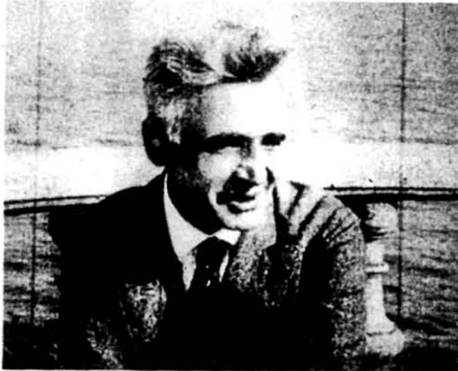
Лесь Курбас у 1920-их роках

На закінчення хочеться підкреслити велику потребу усвідомити українську спільноту та наші громадські установи про пріоритет візуальних засобів масової інформації в сучасній світовій розгрі суспільних та політичних сил. Нам потрібно кріпко та з ентузіазмом підтримувати нашу молодь, яка збагнула вагу так званих „мідій“ і бажає віддати свій талант і працю, щоб шляхом правильної інформації та мистецтва бути корисною для України та її культури.