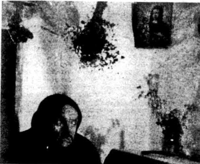
Кадр з фільму „Ой горе, це ж гості до мене“.

„САКС ФІОТ АВЕНЮ“ — ланцюг крамниць, який славиться найновішими та найдорожчими моделями одягу, проданий одним іноземним власником — другому за півтора мільйона доларів. Договір про продаж був підписаний між англійським власником 45-ти крамниць та фінансовою групою Інвесткорп Банк із середнього сходу у вересні минулого року. Новий власник проголосив, що він продовжуватиме вести „Сакс“ у традиційному стилі, але розширить його виводом на європейський ринок та ринок Далекого Сходу. Інвесткорп Банк є співвласником багатьох інших фірм, починаючи від ювелірної „Тифані“ та фірми, яка спеціалізується у продажі італійського шкіряного та модного одягу „Гуччі“, і кінчаючи фірмою „Карвел“, яка виробляє й продас морозиво.