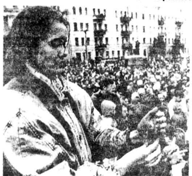
Під час маніфестації в Києві.

Київ. — Пресове агентство Ройтерса інформувало, що 26-го квітня, тобто у четверту річницю чорнобильської катастрофи від якої загинули тисячі осіб, а трагічні наслідки якої годі навіть передбачити, в Києві відбулася багатотисячна жалібна маніфестація у якій взяло участь понад 60,000 осіб зі священними свічками, чорними і національними синьо-жовтими прапорами, трибунами. Маса народу збиралася на площі біля катедр св. Софії, вислухали численні промови, які об'єднували тодішніх і теперішніх офіційних осіб за занедбання справи безпеки населення у висліді чого мільйони осіб в Україні і Білорусії були заражені атомовою радіацією і масово вмирають від хворіб рака, зокрема лейкомі, виразки шлунка та інші хвороби пов'язані з радіацією. Навіть офіційна статистика подає, як пише „Едмонтон Джорнал“ з 26-го квітня, що понад один мільйон українців є заражених атомовою радіацією і мусять числитися за етнічними наслідками, які дуже часто приходять несподівано.