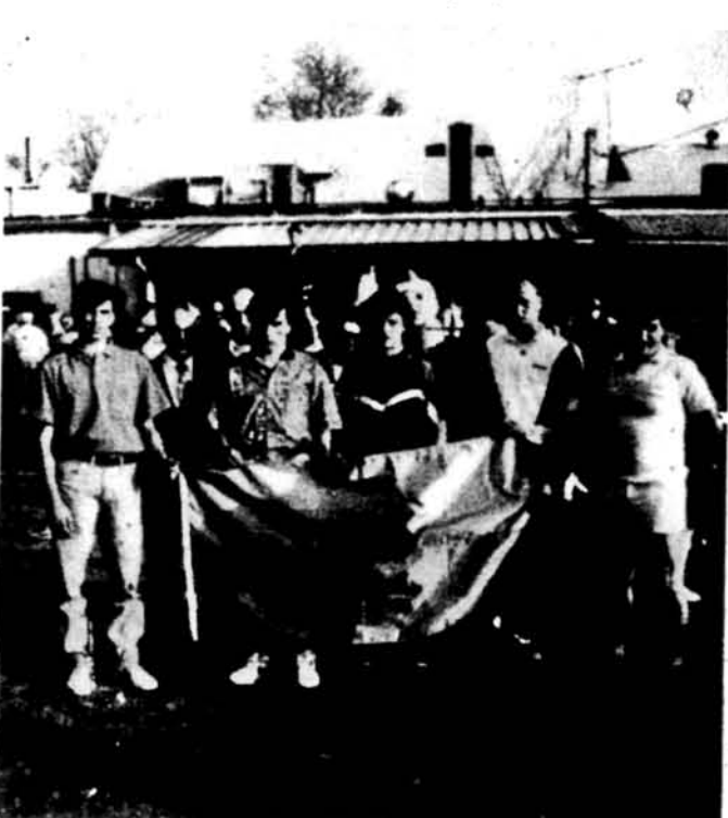
Група змагунів „Карпат“ вже після змагань із синьо-жовтим прапором