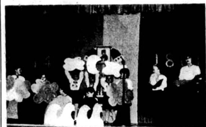
Інценізація «Реве та стогне» учні першої класи.