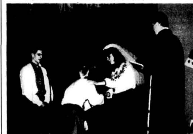
Інценізація «Лебедін» учні 9-ої і 10-ої класи.

25-го березня о 2-й год. батьки, дідуся, бабусі та гості заповнювали залу Дому СУМА при 301 Палісейд ав. у Йонкерсі. Усі вони сходилися на програму, яку влаштувала самостійними силами Школа Українознавства при парафії св. Михаїла. Ця програма була в пошані Великого Кобзаря Тараса Шевченка.