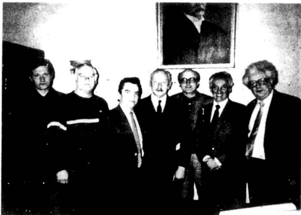
Зустріч з культурними діячами у Львові.