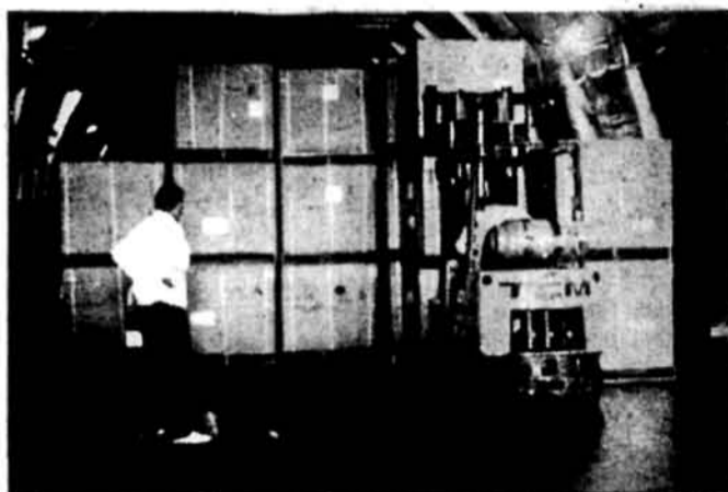
Ладують дитячу їжу у скринях до транспортного літака „Руслан“