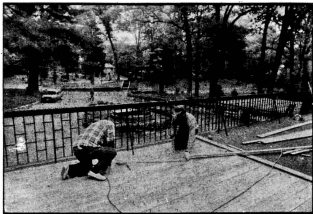
Робітники перебудовують терасу у „Гостиниці”.