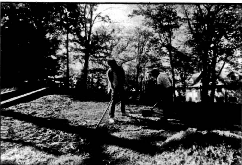
Робітники підготовляють землю на квітники, якими пишно піклується господиня Софія Шпак.

Ще тільки короткий час залишився до цієї хвилини, коли у широку, привітну в'їздову браму Союзівки будуть авто за авто спішити гості, батьки і діти на тенісові та звичайні табори, наймолодше українське покоління на табори пташат та всі ці інші гості із різних закутків ЗСА, що постійно літом відвідують Союзівку, щоб провести на тому класичному українському землі принаймні короткі вакації. Є такі вакаційні гості, що повертаються тут кожного року, відомі як „постійні гості”. Вони тут немов „дома”. Але є і нові приїжджі, які вперше будуть побувати на оселі УНСоюзу, зокрема із молодшого покоління, і вони шукають також за українським товариством, але й за можливістю купелі, гри теніса чи вечірньої забави. Все це вимагає від оселі відповідної і довготривалої підготовки, яка саме тепер іде повною парою, щоб завершитися до першого великого „наїзду”, що звичайно відбувається у День Незалежності ЗСА.