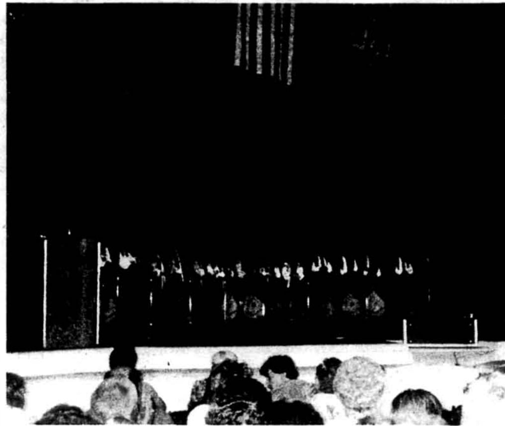
Ансамбль „Гомін степів“

ків, деякого привабив смач- ний запах вареників, ковба- си та капуста, але найбіль- ше людей зібралось на пло- щі під відкритим небом.