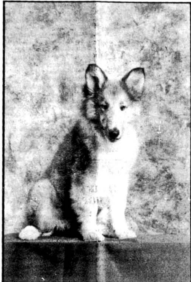
Найновіший мешканець Союзівки — тримісячний песик „Чемпіон”

Ще тільки короткий час залишився до цієї хвилини, коли у широку, привітну в'їздову браму Союзівки будуть авто за авто спішити гості, батьки і діти на тенісові та звичайні табори, наймолодше українське покоління на табори пташат та всі ці інші гості із різних закутків ЗСА, що постійно літом відвідують Союзівку, щоб провести на тому класичному українському землі принаймні короткі вакації. Є такі вакаційні гості, що повертаються тут кожного року, відомі як „постійні гості”. Вони тут немов „дома”. Але є і нові приїжджі, які вперше будуть побувати на оселі УНСоюзу, зокрема із молодшого покоління, і вони шукають також за українським товариством, але й за можливістю купелі, гри теніса чи вечірньої забави. Все це вимагає від оселі відповідної і довготривалої підготовки, яка саме тепер іде повною парою, щоб завершитися до першого великого „наїзду”, що звичайно відбувається у День Незалежності ЗСА.