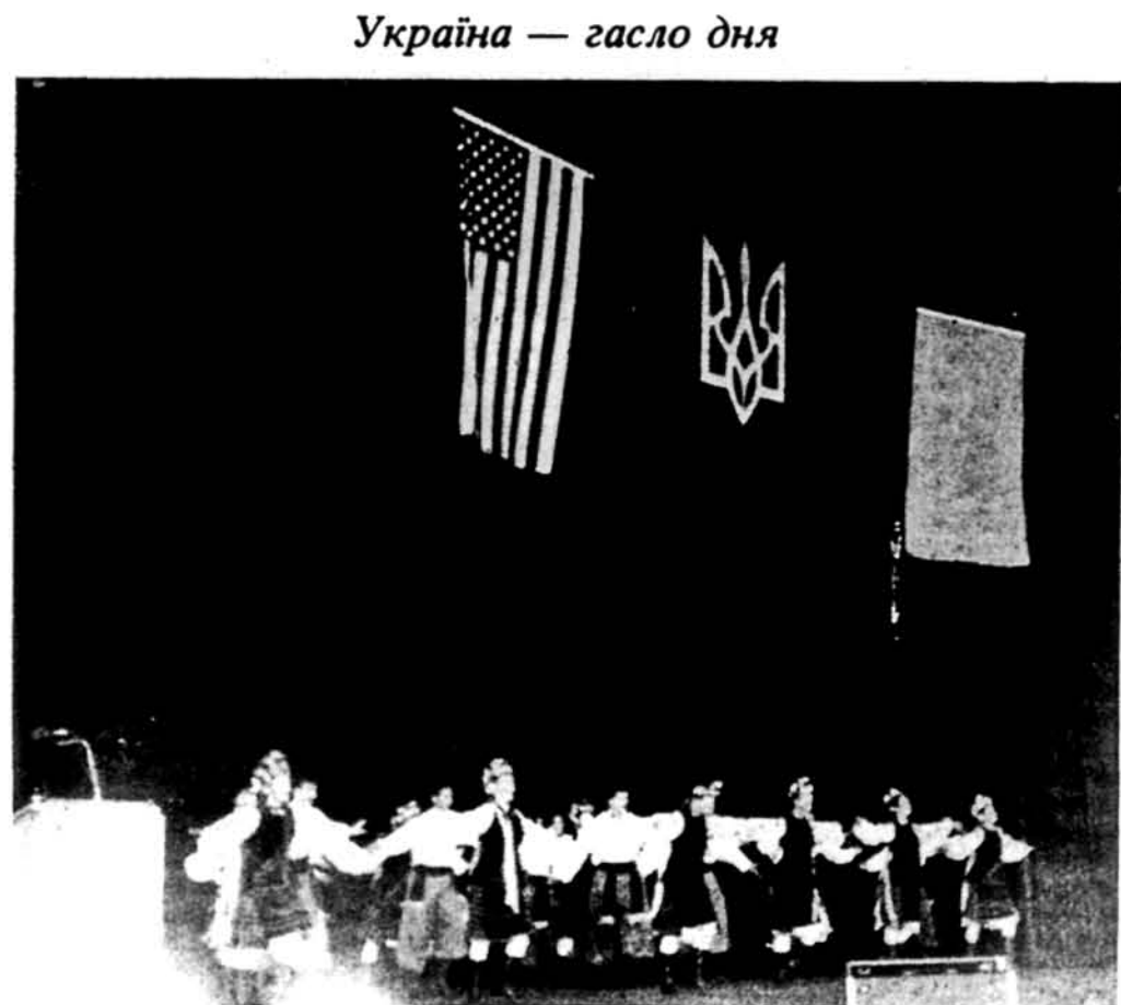
Танцювальний ансамбль «Волошки»