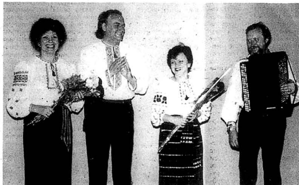
Прозвучали останні акорди, а в залі ще довго не стихали оплески, якими вдячні глядачі нагороджували артистів за вдалий концерт.

— це ідейні борці за волю свого народу. В своїх творах він змальовує завжди перемогу добра над злом. Щоб людина „тала суспільною, справжньою людиною, а не звірною на взір московських зольшевиків і німецьких гітлерівців та афро-азійських наслідків московсько-большевицьких матеріалістичних теорій класової боротьби.“