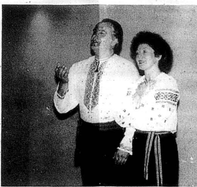
Народні артисти України Людмила Маковецька та Олександр Трофимчук виконують пісню „Люблю я тебе, Україно“.

Треба віддати належне артистам і за цікаво підібраний репертуар, і за вдале чергування виконуваних творів: українські народні і сучасні пісні чергувалися заріями з відомих опер, сольно і дуєти — з музичним виконанням класичних творів. Наприклад, піаністка Ольга Нечипоренко з особливим ніжністю передала першу частину популярної „Місячної сонати“ Л. Бетовена — твір, який відзначається багатством настрів і темпів. В її виконанні прозвучали і „Елегія“ Миколи Лисенка.