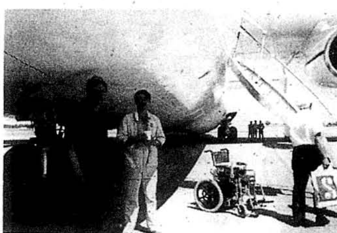
Кріскало для хворого в Києві чекає на владування до літака