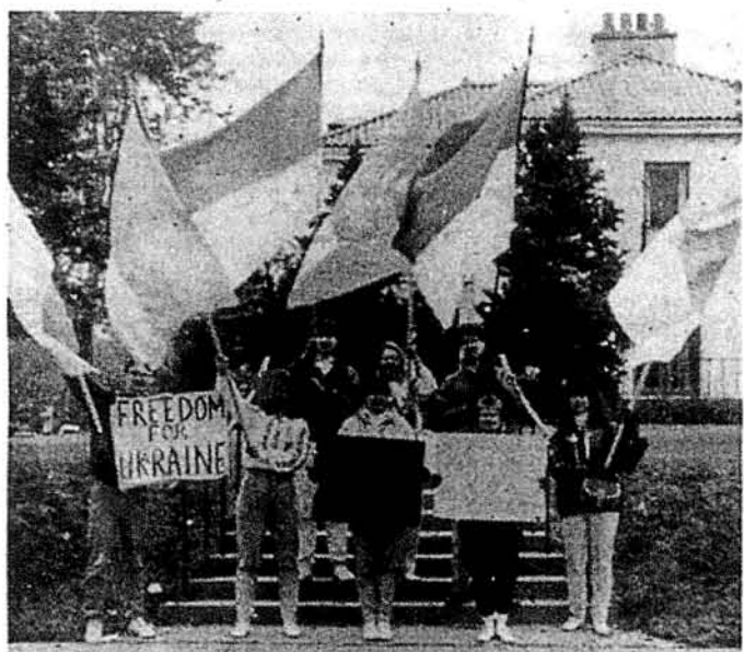
Група сумівців після демонстрації в Міннесоті

Десятки сумівців ввійшли у склад української демонстрації за вільну Україну в неділю 3-го червня з нагоди приїзду Горбачова до Міннесоти.