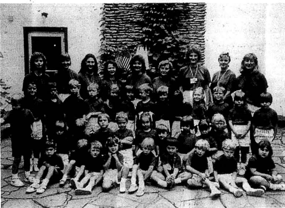
Дві групи табору пташат при Пласті