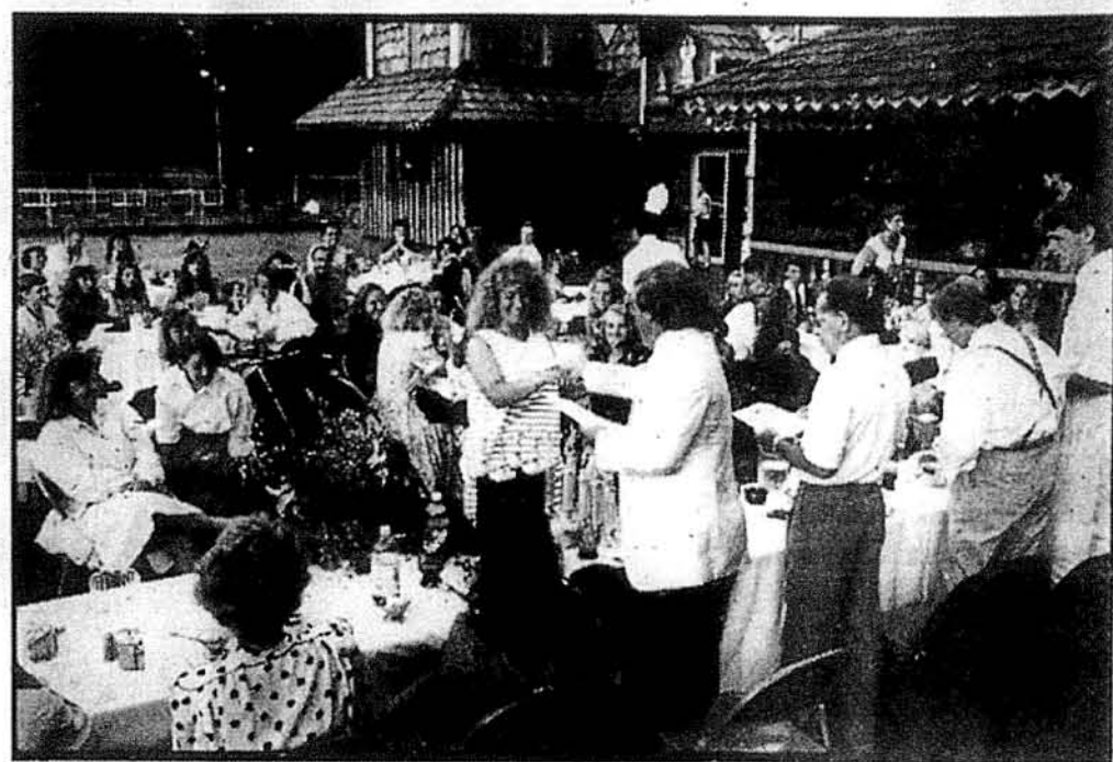
Заключний бенкет тенісового табору на терасі „Веселки”

Іван Кедри ЖИТТЯ — ПОДІЇ — ЛЮДИ СПОМИНИ та КОМЕНТАРІ Ціна $21.25 з пересилкою Мешканців стейту Нью Джерсі зобов'язує 7% стейтського податку SVOBODA BOOK STORE 30 Montgomery Street Jersey City, N.J. 07302