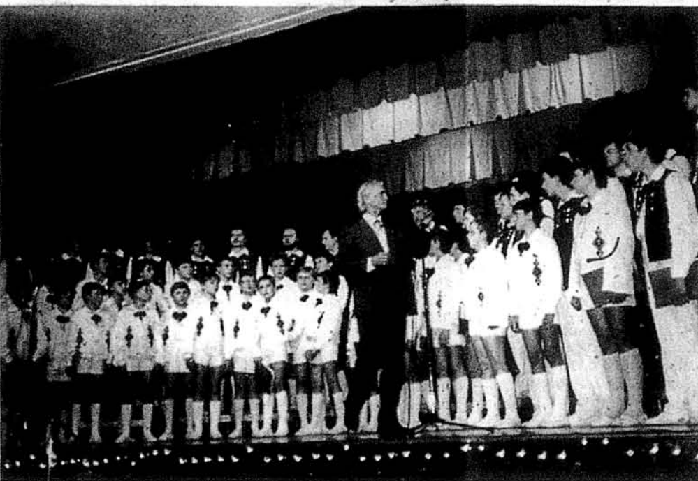
Хор „Дударик” на сцені Союзівки

Ваканційний сезон на Союзівці почався приїздом хору хлопчиків і юнаків „Дударик” з Львова у червні і його концертом, що й надало тон червневим дням на цій оселі УНСоюзу. Відтак відбувся тенісовий табір, короткі відвідини футболістів ФК „Карпати” з Львова, табір пташат при Пласті, а закінчився цей цикл участю молодих працівників оселі у святкуваннях Дня Незалежності в Елленвіллі, Н. Й.