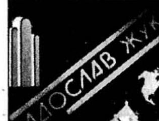
Афіша з виставки творів Радослава Жука