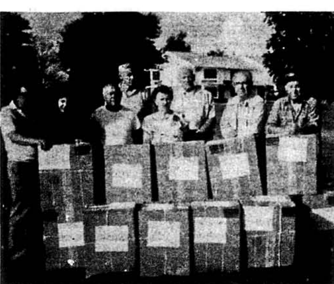
Члени Групи Сприяння в Українському Селі перед відправою допомоги дніпропетровцям.

Наслідок повідомлення від Рухінформцентру та інших пресових незалежних служб, що наслідки допомоги не заборилися, на Дніпропетровщині активізувала діяльність демократичних організацій. Зокрема почав активно діяти Комітет за Відродження УАПЦ, Рух, ТУМ, УРП, СНУМ, регіональна організація Демократичної Партії, Народ на Партія. Наприкінці, 7-