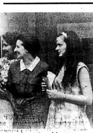
Михайло Горинь серед працівників Музею.

Голова секретаріату Народного Руху України, заступник голови Народної Ради у Верховній Раді УРСР Михайло Горинь відвідав Музей. Його зацікавлення Музеєм було не банальним, а наскладовим характеру. Він ознайомився з постійною експозицією Музею, фондосховищем, черговою виставкою, яка експонується зараз у Музеї „Мистецтво афіші в сучасній Україні“, цікавився історією музею та його планами на майбутнє.