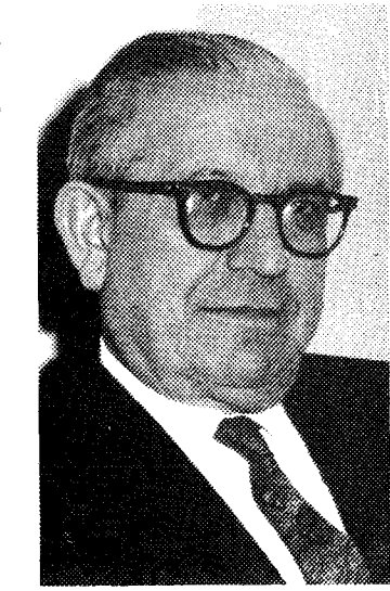
Св. п. Юліан Ревая

них русинів, на це вказує прощальне слово парохів цієї церкви, який англійською мовою детально перело в історію Карпатської України й про працю Ревая, як тодішнього прем'єра уряду вільної країни. Прощав Ревая на вічну дорогу й карпатський єпископ Михайло Дудик, висловлюючи особисте співчуття родині, з приводу смерті передового й відрізняючого ідейного працівника нашої громади великого Нью Йорку.