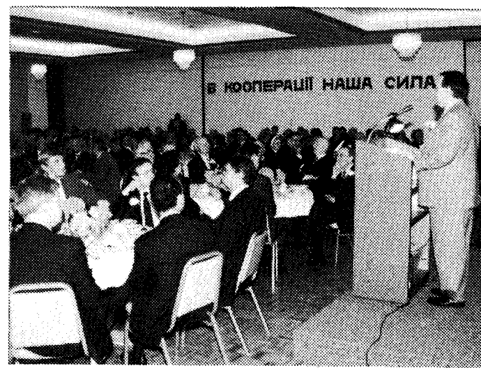
Виступає директор європейського відділу Світової Ради Кооператив Дін Мен.