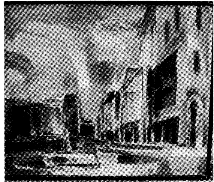
Борис Бурак, „Львів, площа Ринок”, 1990 р. (полотно, олія).

готовленим до появи для Бориса Бурая дається без особливих зусиль, адже його погляд на світ і на мистецтво залишається методологічно таким же. Він, як і раніше, хоче свою духовну енергію спрямувати на „творення світу, який був би повновартісним”, в якому життя було б піднесене до рівня „мистецької небуденщини”. І цього він досягає всупереч тому, що живе в однакових умовах, якого не лякає присутність у творі відзвуків політичних, просвітницьких, етичних пристрастей сучасної йому доби. Про те, що це не вкладається в його творчості сухим репортажним рядком, свідчить одне з останніх полотен „Підкутанський плач”. Не відсторонюючись від формально-ремісничих завдань свого фаху, Борис Бурак має підстави самозаглибитися і в свою громадянську сутність, щоб сказати: „Якщо нині народ потребує згуртованості, то цю згуртованість зобов'язаний підтримувати художник, — теми можливостями, які йому дані від Бога”.