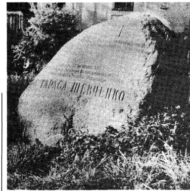
Пропам'ятний камінь на Смоленському кладовищі в Ленінграді, де був похований Т. Шевченко.

ськ, кандидат філософських наук, член Спілки письменників ССРСР і управління Т-на ім. Т. Шевченка на місці, де був похований Великий Кобзар 12-го березня 1861 року, а відтак перевезений до Москви і в Україну, Товариство його імені у Ленінграді поставило 10-го березня 1989 року пропам'ятний камінь. Це гранітна брила має два написи: українською мовою читайте із „Заповіту“ „Поховані та вставайте, кайдани порвіте...“ і російською: „Тут 12 березня 1861 р. було проведено поховання Великого поета України Тараса Шевченка“. З батьківщини Кобзаря із села Моринці привезено землю і розсипано її навкруги пропам'ятного каменя.