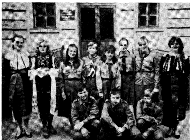
Група пластунів і вчителів перед входом до УАГ, перед відходом на змовище, щоб вітати учасників із диспоси.