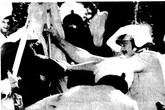
Міліціанти і відділи міністерства внутрішніх справ вивчають сино-жовті прапори з рук демонстрантів, які протестують проти союзного договору.

Українське незалежне інформаційне агентство «Рес-публіка» наголосило на негативній оцінці проекту наступником голови Верховної Ради Володимиром Гриньо-