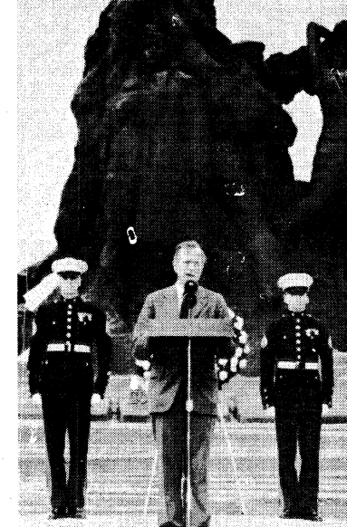
Президент Джордж Буш промовляє біля пам'ятника жертвам Бабиного Яру в Києві.

„Ми не будемо вибирати ці фаворизувати перемож-ців, чи переможених”, — за-явив президент.