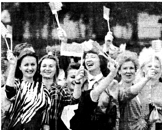
Молоді жінки вітають Президента ЗСА на вулицях Києва.