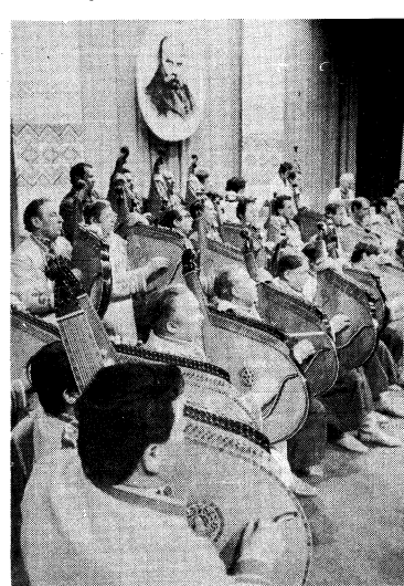
Струсівська капеля бандуристів „Кобзар“.

Найбільшими подіями в житті капелі були виступи в Києві — з Капеллю залі Імени М. Ісенка, на батьківщині Остапа Вереся — в с. Сокіриних на Чернігівщині, у місті Канданові на могилах Раїси Шевченко, де бандуристи поновили спадку своїм самобутнім виконанням. Струсівські кобзарі успішно виконують складні корови та інструментальні твори української та зарубіжної класики.