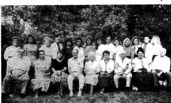
Учасники вчительського семінара на Соювізці

Соювізка. — Тут розпочався Вчительський Семінар для підвищення педагогічних кваліфікацій вчителів шкіл українства. Це вже сьомий з черги рішдншкільний семінар, який влаштує Шкільна Рада, а спонсором його Український Народний Союз.