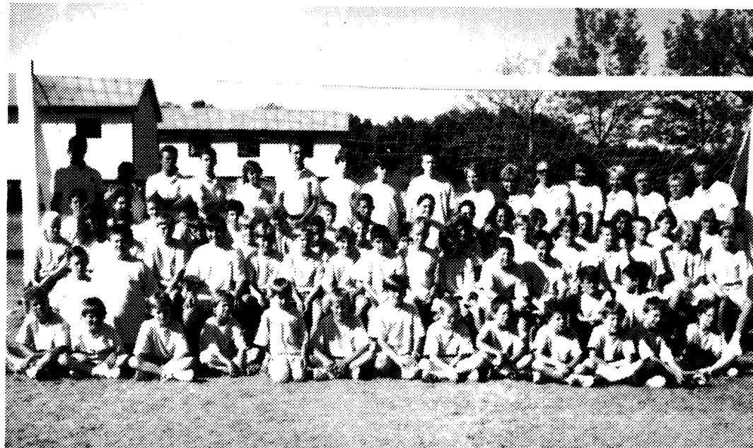
Учасники й інструктори Спортової Школи „Чорноморська Січ” під час другого тижня.