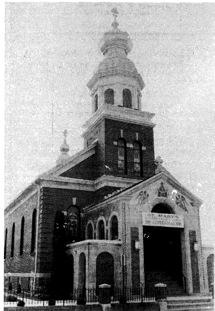
Церква Покрови Пресвятої Богородиці у Мек Ару.

Перші емігранти, що приїхали до З'єднаних Штатів Америки, привезли зі собою глибоку віру і культуру. Ті, що оселилися в Мек Ару, Пенсильванія, не мали своєї церкви. У неділю вони вставали дуже рано і пішки йшли через гори, щоб вислухати Службу Богу в першій українській католицькій церкві св. Михаїла в Шенандо, яка була 10 миль від Мек Ару.