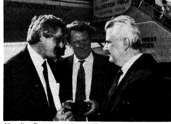
Михайло Балагурак (зліва) і Григорій Бугай прощаються з Президентом Леонідом Кравчуком. (Світлиця: Ден Форд Конолі).