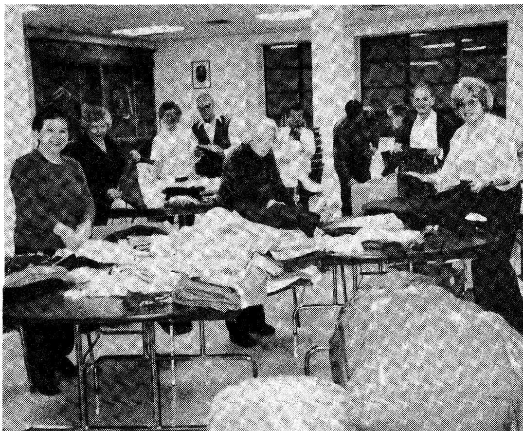
Члени ванкуверського Відділу Суспільної Служби Українців Канади за роботою.

Першою діяльністю відділу було вироблення програми та придбання фондів, без яких праця будь-якої організації, особливо харитативної, немислима.