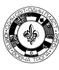
ВІДЗНАКИ ЮМПЗ — 92