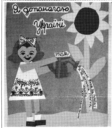
Ніна Матійко, 7 років, перше місце, I група.

I, as a Ukrainian, am proud of my heritage and beliefs. I am also proud of Ukraine. Ukraine is a beautiful place and I believe that the people there should be able to live there without fearing what the next day may bring.