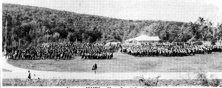
Учасники ЮМПЗ — 82 на „Вовчій Тропі“ 35-та