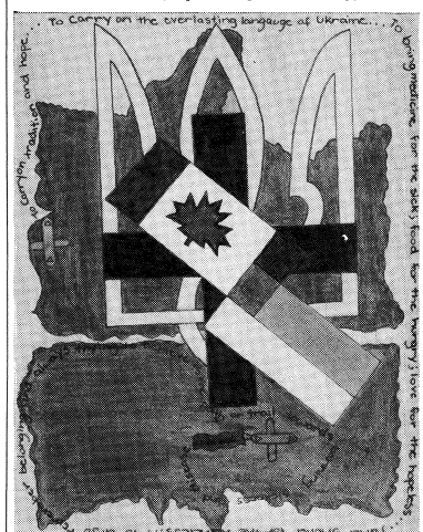
Кася Пич, 13 років, друге місце, II група.