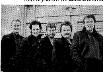
Рок-група „Фата моргана”.

Союзівка (Г. Колесова). Як уже інформовано, тут під час вікенду 22–23-го серпня відбудеться відзначення першої річниці проголошення незалежності України, в рамках якого – суботній концерт Українського Національного Хору (мистецький керівник та диригент – Михайло Дяболо), який відбудеться в залі „Веселки” о год. 8:30 вечора та концерт під критичним небом вокально-інструментального ансамблю „Фата моргана” у неїлю, 23-го серпня, початок о год. 2:15 по полудні.