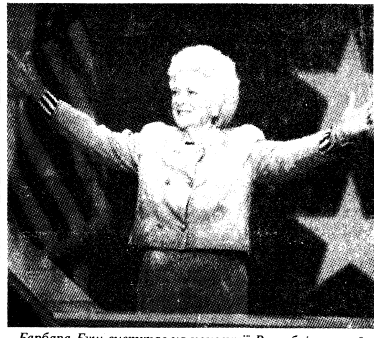
Барбара Буш виступає на конвенції Республіканської партії.

НА НАДЗВИЧАЙНОМУ засіданні Верховної ради Вірменії президент республіки Левон Тер-Петросян виніс на обговорення питання про проведення референдуму з приводу довіри до нього як до керівника держави. Намагання опозиції змусити його зрегентувати президент трактував як спробу державного перевороту.