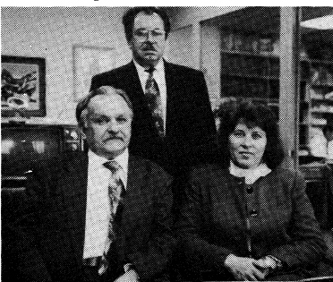
Амбасадор до Польщі Т. Старак (перший з лів) в редакції „Свободи“. Поруч нього М. Дуляк, стоїть І. Грес.

М. Дуляк інформувала, як завжди ділово і коротко, як це сталося, що послом Т. Старак перебуває саме тепер — напередодні закінчення свого завдання у Варшаві, тут у ЗСА. Прийняв він на запрошення ООЛ щоб взяти участь у XXXIII Крайовому з'їзді, а при тому мати нагоду зустрітися з українською громадою в ЗСА, не лише зі своїми близькими земляками із Лемківщини. М. Дуляк запропонує посломові зустріти своїх сестрих лемківських і від того часу вони були у постійному контак-