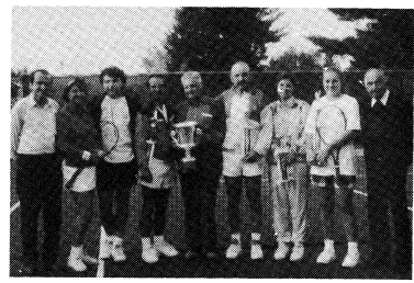
Фіналісти турніру з організаторами.

Союзівка. — Тут у суботу і неділю, 10-го і 11-го жовтня, відбувся останній турнір сезону — клубові першості Карпатського Клубу.