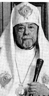
Патріарх УАПЦ Мстислав

Історія свідчить, що з-поміж усіх християнських