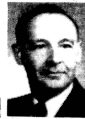
39 І. Пиндус — 5