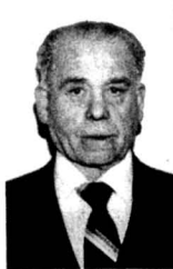
200 І. Пригода — 7