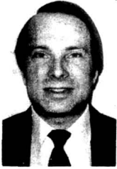
32 В. Яш — 8