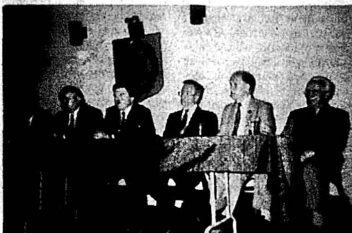
Амбасадор України у Вашингтоні Олег Білорус та працівники українського консульства в Нью-Йорку на зустрічі з українською громадою в Українському Народному Домі.

Нью-Йорк (д-р Тамара Булат). — Несприятелюючи вога про долю Батьківщини заучала на зустрічі представників українського дипломатичного корпусу з українською громадою. Це було в неділю, 20 червня. Український Народний Дім приймав амбасадора України в ЗСА Олега Білоруса і членів консульства України в Нью-Йорку — генерального консула Віктора Крижанівського та його дружину Людмилу, консула Миколу Кириченка, віцеконсула Євгена Корнійчука.