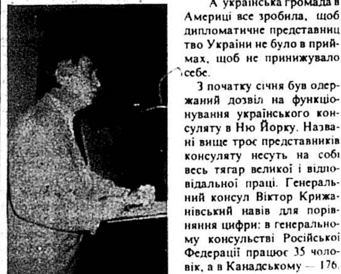
Виступ Генерального консула України в Нью-Йорку Віктора Крижанівського.

Люди зібралися в залі, щоб обговорити невідкладну і важливу справу — придбання будинку для українського консульства в Нью-Йорку. Спочатку з напруженою увагою присутні вислухали промову амбасадора Олега Білоруса, який подав картину економічного і соціально-політичного стану в Україні, індустрі-