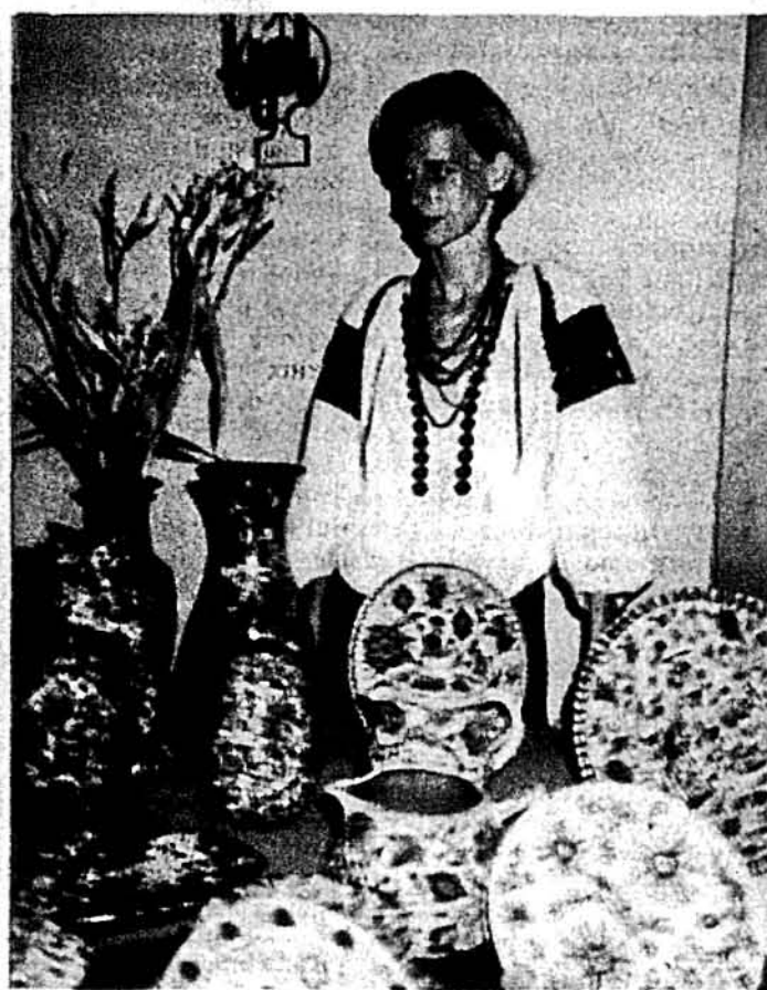
Кераміка С. Зелик