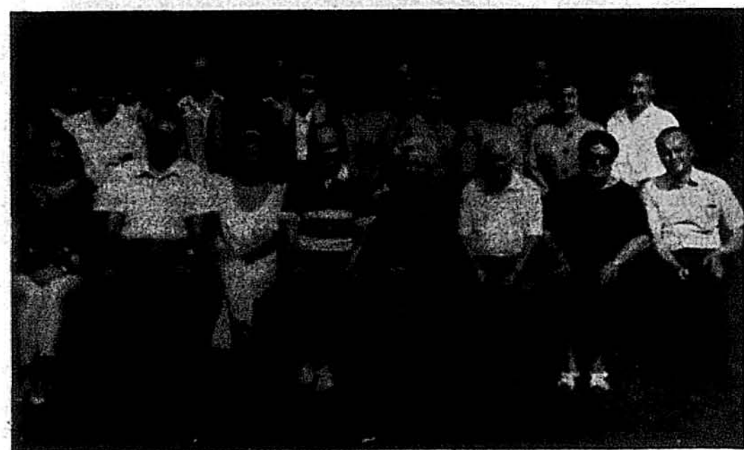
Учасники вчительського семінару на Союзівці

Союзівка. — Тут на оселі Українського Народного Союзу від 1-го серпня 1993 року проходить щорічний двотижневий вчительський семінар, дев'ятий з черги, організований Українською Шкільною Радою Аме-