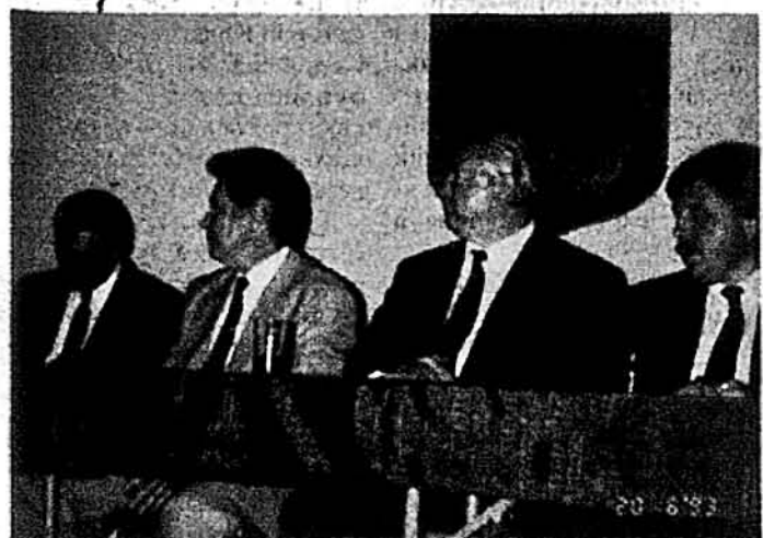
Наші дипломати на вічу 20-го червня 1993 року (зліва): консул М. Кириченко, генеральний консул Віктор Крижанівський, амбасадор Олег Білорус, заступник амбасадора В. Батюка, В. Хандогій.

Нава'язуючи до справи підсилення нашої дипломатичної служби новими працівниками, щоб бути на рівні у своїй дипломатичній праці з іншими народами, а