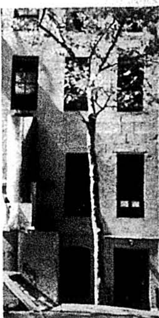
Будинок генерального консуляту в Нью Йорку в стадії перебудови.

ськими дипломатами і 22 українськими працівниками. На кінець липня цього року вона налічує понад 50 американських і понад 100 українських службовців. Тоді як Україна з днем проголошення самостійності налічувала 120—140 працівників. Тепер ця кількість зросла до 240 працівників (на кінець 1992 року). Припускаємо, що в 1993 році ця кількість збільшиться. Можливо навести ще більше прикладів, але те, що ми подали, наскільки достатньо ситуацію, яку чимось більше треба направити, бо без належної організованої дипломатичної служби наші політичні справи і державні інтереси не будуть мати великих успіхів серед чужинського світу.