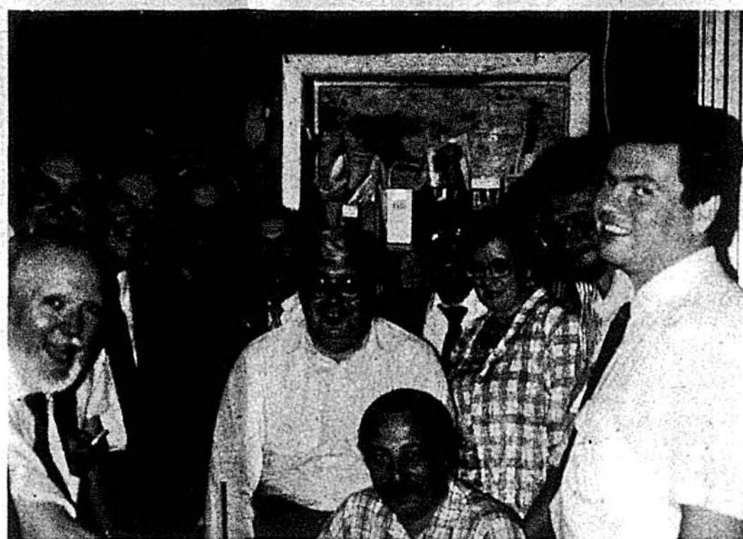
Члени управи Метрополітального Відділу Фонду Генерального Консуляту, представники телевізійної програми „Контакт” і будівельного персоналу.