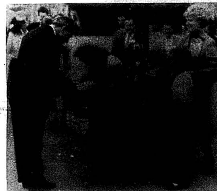
Хлібом і сіллю вітають австрійського амбасадора Г. Вайса.