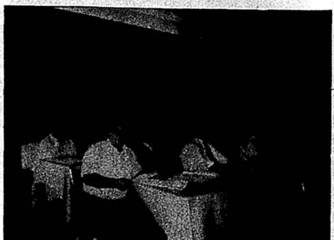
Учасники наради на Союзівці